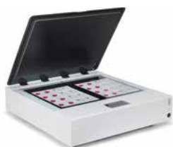
EyeC Profiler 400 - 600 DT