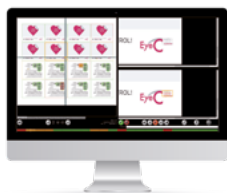
EyeC Profiler Content