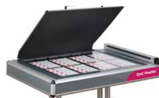
EyeC Profiler 900 - 1200 DT