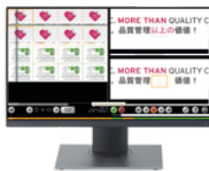
EyeC Profiler Graphic