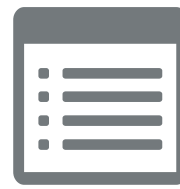
Audit Trail Viewer