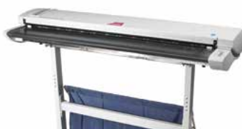
EyeC Profiler 900 - 1100 CS